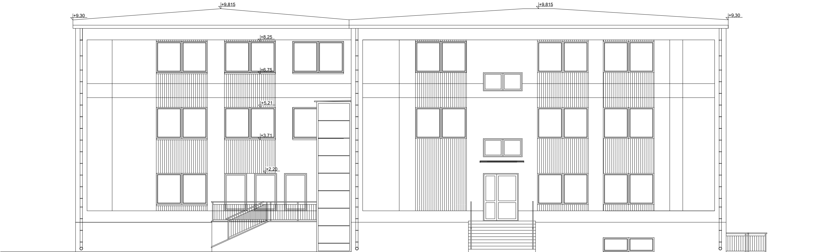
Elewacja boczna - północna